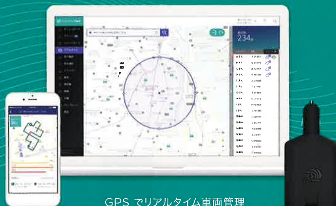
GPS でリアルタイム車両管理