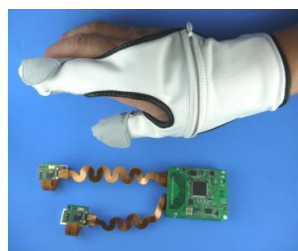
(図2) 3原触グローブとFPC