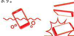
水没・落下にも耐える耐久性

タフな作業環境に耐える、IP67規格に準じた防塵・防水設計。1.2mの高さからコンクリート地面に複数回落下しても正常に動作します。