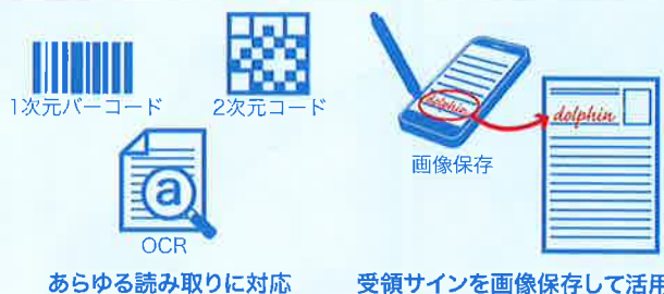
あらゆる読み取りに対応

業界最先端のプロセッサ/クワッドコアCPUを搭載し、低消費電力で高速なアプリケーションパフォーマンスを実現。また、ハネウェルならではの高性能バーコード解読技術により、あらゆるコードを迅速かつ正確に読み取り、生産性向上に貢献します。